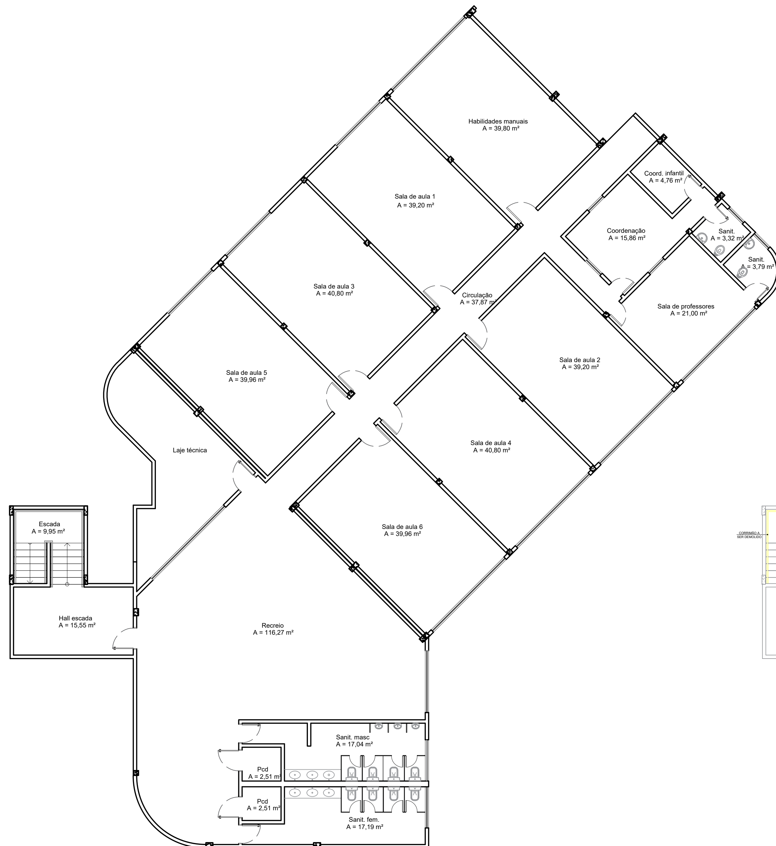
01 PLANTA BAIXA — SUPERIOR — EXISTENTE ESCALA: 1:100